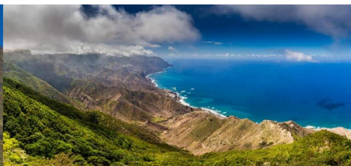
Costa di Taganana